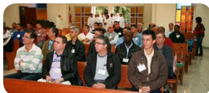
Atual turma preparatória para o Diaconado

O segundo momento da abertura aconteceu no auditório do Seminário, onde Dom Gil demonstrou imensa alegria em ver que o serviço diaconal na Arquidiocese está crescendo. A diretoria da Escola Diaconal foi apresentada. Em uma conversa com os futuros diáconos, o Pastor explicou sobre o serviço diaconal, a diferença entre o diaconado transitório e o diaconado permanente e ainda citou alguns casos em que diáconos permanentes que ficam viúvos chegam a ser ordenados