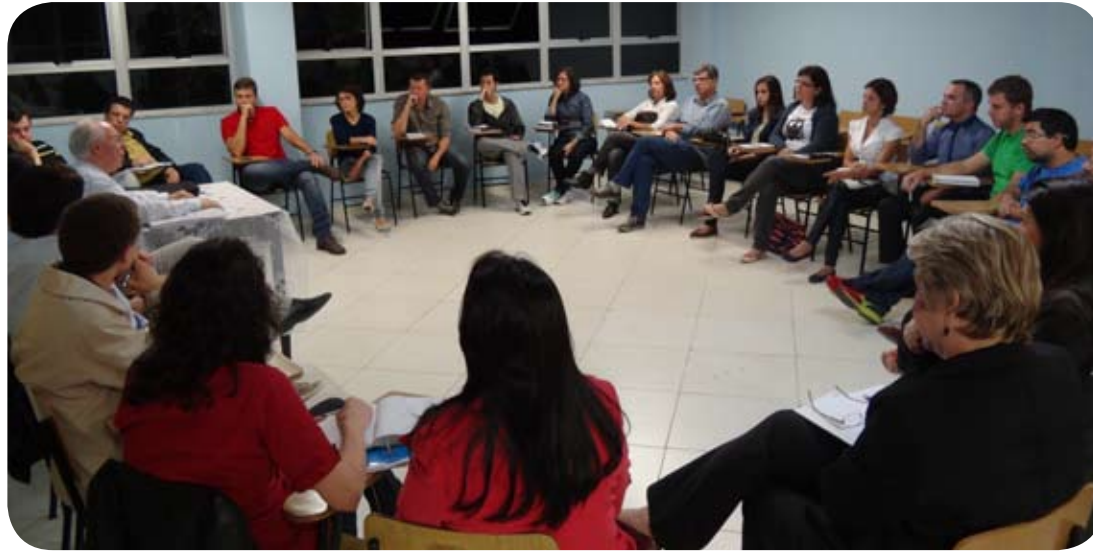
Integrantes da Comissão Arquidiocesana de Direitos Políticos

A comissão será composta, inicialmente, por aproximadamente 20 pessoas. Elas terão a responsabilidade de, juntamente com os grupos