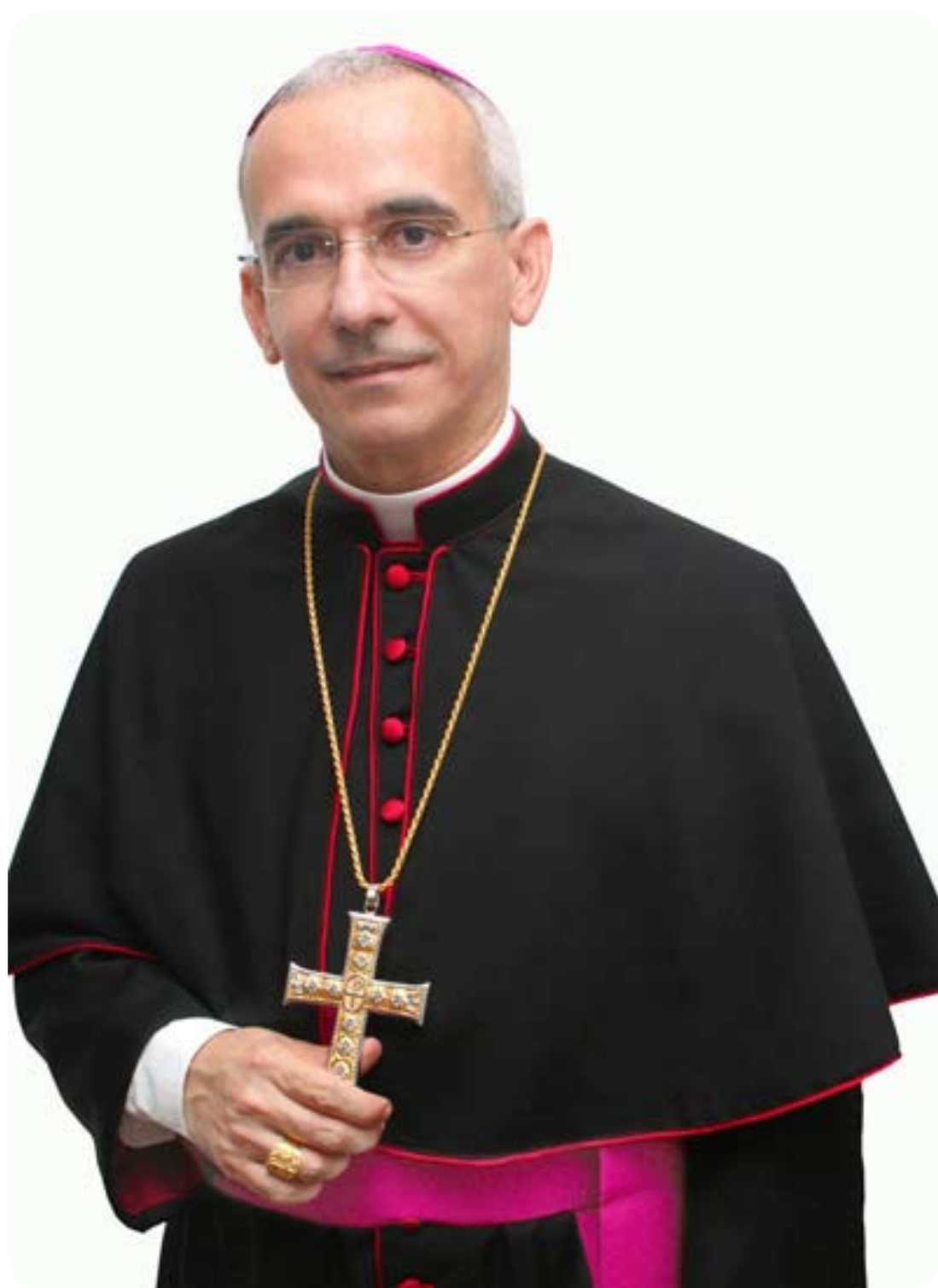
Dom Henrique Soares da Costa - Bispo de Palmares (PE).

Em 1º de abril de 2009 foi nomeado pelo Papa Bento XVI como Bispo-Auxiliar da Arquidiocese de Aracaju (SE). Foi ordenado Bispo no dia 19 de junho de 2009, por imposição das mãos de Dom Antônio Muniz Fernandes, Arcebispo de Maceió. Escolheu por lema In Christo Pascere (Apascentar em Cristo). No dia 19 de março de 2014, o Papa Francisco o nomeou Bispo da Diocese de Palmares.