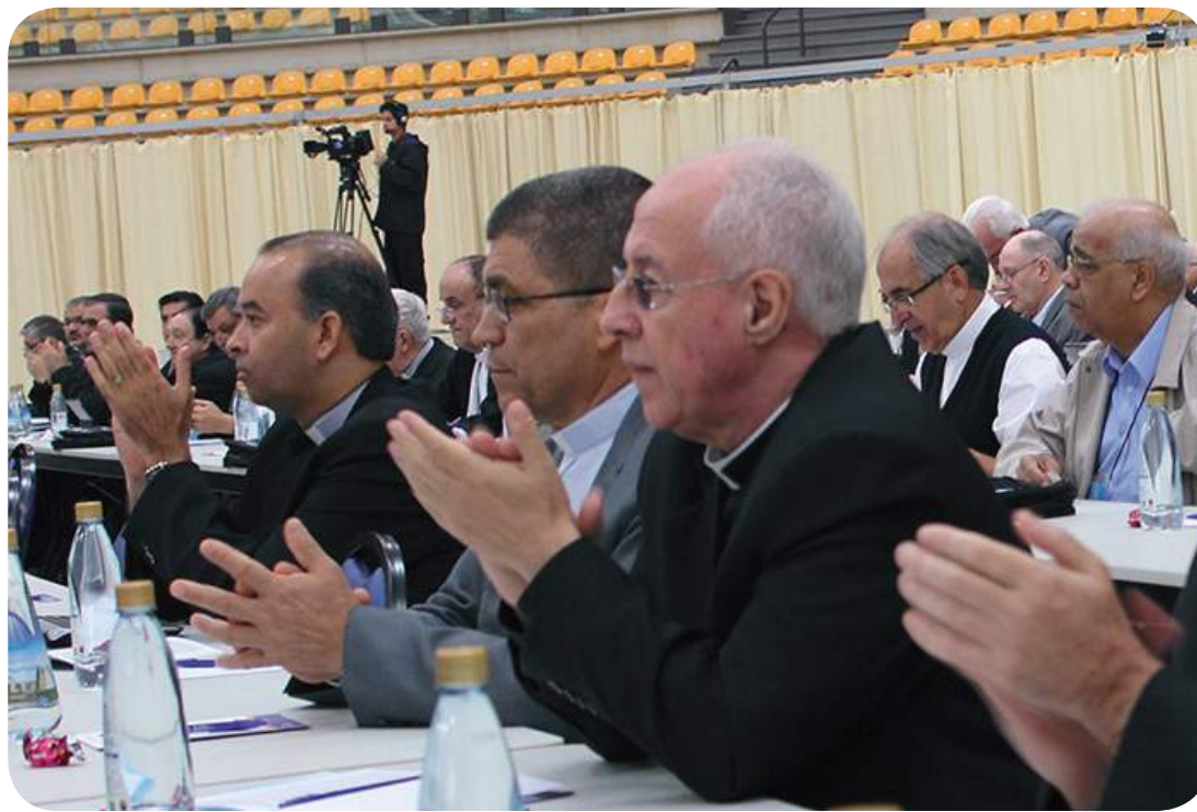
Arcebispo de Juiz de Fora, Dom Gil Antônio Moreira, junto a outros Bispos do Brasil durante a 53ª Assembleia Geral da CNBB.

da-feira, começaram as eleições para a nova Presidência da CNBB. O Arcebispo Metropolitano de Brasília (DF), Dom Sérgio da Rocha , foi eleito como Presidente da Conferência Nacional dos Bispos do Brasil (CNBB). Por este motivo, nesta edição, a Folha Missionária faz sua homenagem especial, na última página, ao novo Presidente da CNBB.