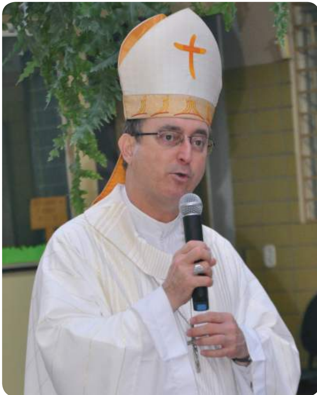
Dom Sérgio da Rocha - Novo Presidente da CNBB.

Trabalhou no Seminário Diocesano de Filosofia, em São Carlos, como Diretor Espiritual, Professor de Filosofia e Reitor. No Seminário de Teologia de São Carlos, em Campinas, foi Diretor Espiritual e Reitor; foi, também, Professor e membro da Equipe de Formação dos Diáconos Permanentes da Diocese de São Carlos. Exerceu, ainda na Diocese de São Carlos, as seguintes funções pastorais: Assessor da Pastoral da Juventude; Coordenador da Pastoral Vocacional; Coordenador da Escola de Agentes de Pastoral; Coordenador Diocesano de Pastoral; Vigário Paroquial das Paróquias Nossa Senhora de Fátima e Catedral; Reitor da Igreja São Judas Tadeu, em São Carlos; Pároco de Água Vermelha e de Santa Eudóxia.