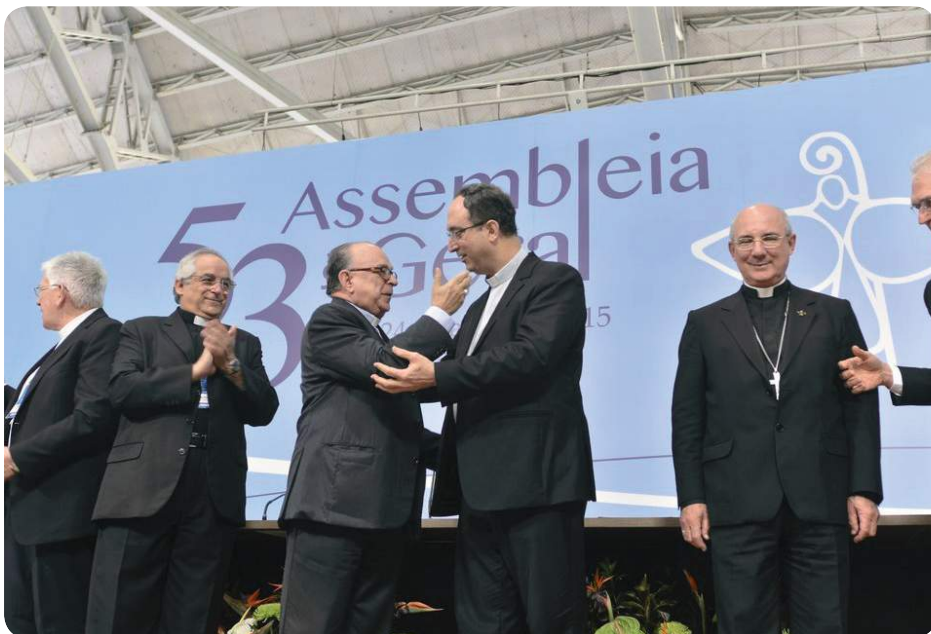
Cerimônia de posse do novo Presidente da CNBB, Dom Sérgio da Rocha.

Celebração na Catedral de Juiz de Fora marca Ordenação Diaconal