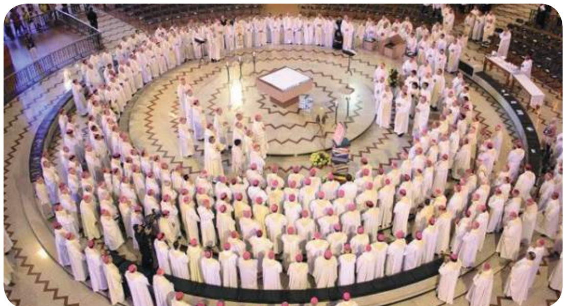
Bispos de todas as partes do Brasil reunidos na Basílica de Nossa Senhora Aparecida.

Convido a todos para que estejam unidos espiritualmente a nós na busca de uma Igreja sempre mais viva, mais feliz, mais alegre e mais comprometida com a causa da dignidade da pessoa humana, na busca da construção do Reino de Deus entre nós, na esperança segura do Reino definitivo na eternidade.