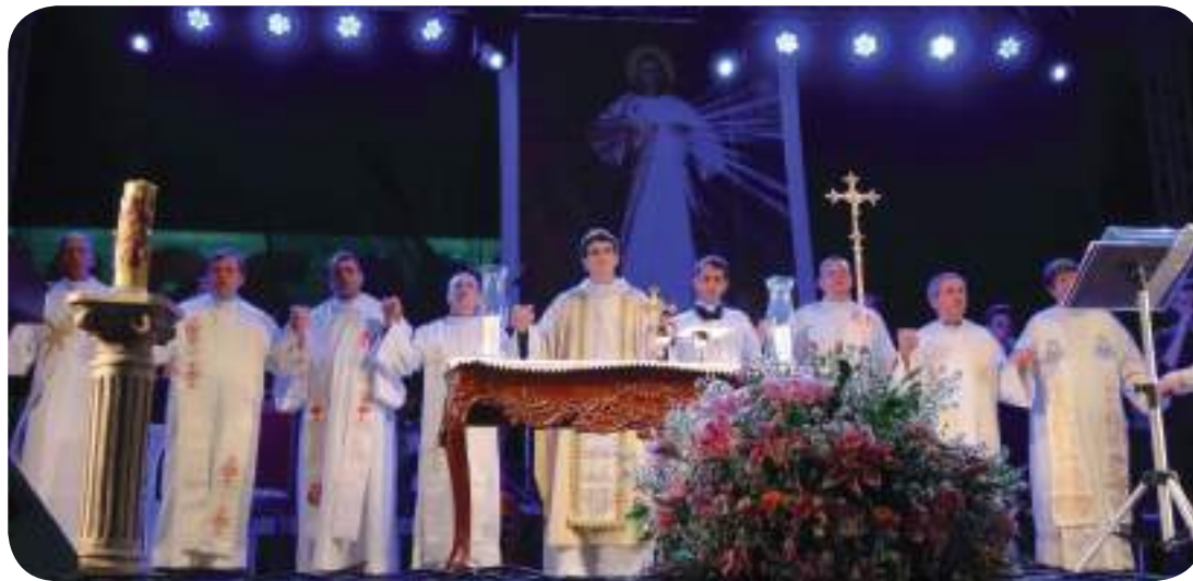
Pe. Reginaldo Manzotti celebrou junto ao clero de Juiz de Fora