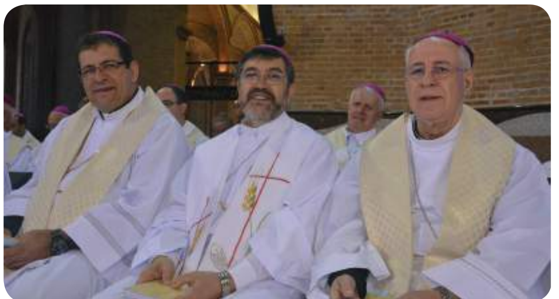
Dom Gil Antônio Moreira ao lado de Dom Vilson, Bispo de Limeira (SP) e Dom João Bosco, novo Bispo de Osasco (SP).