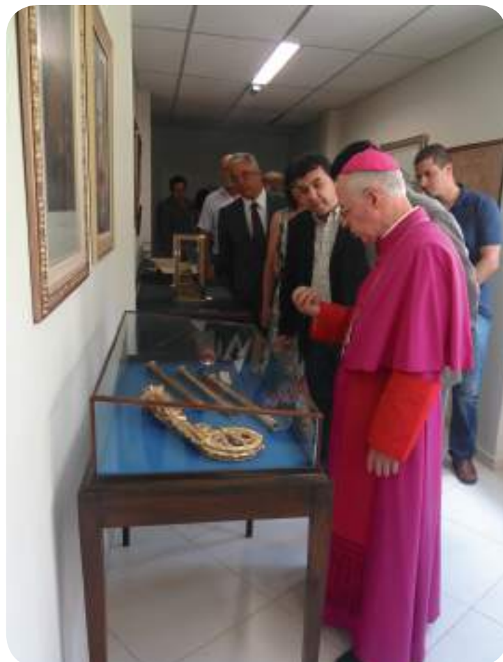
Páginas 4 e 5

Primeira imagem de Santo Antônio em Juiz de Fora é restaurada e recolocada na Catedral