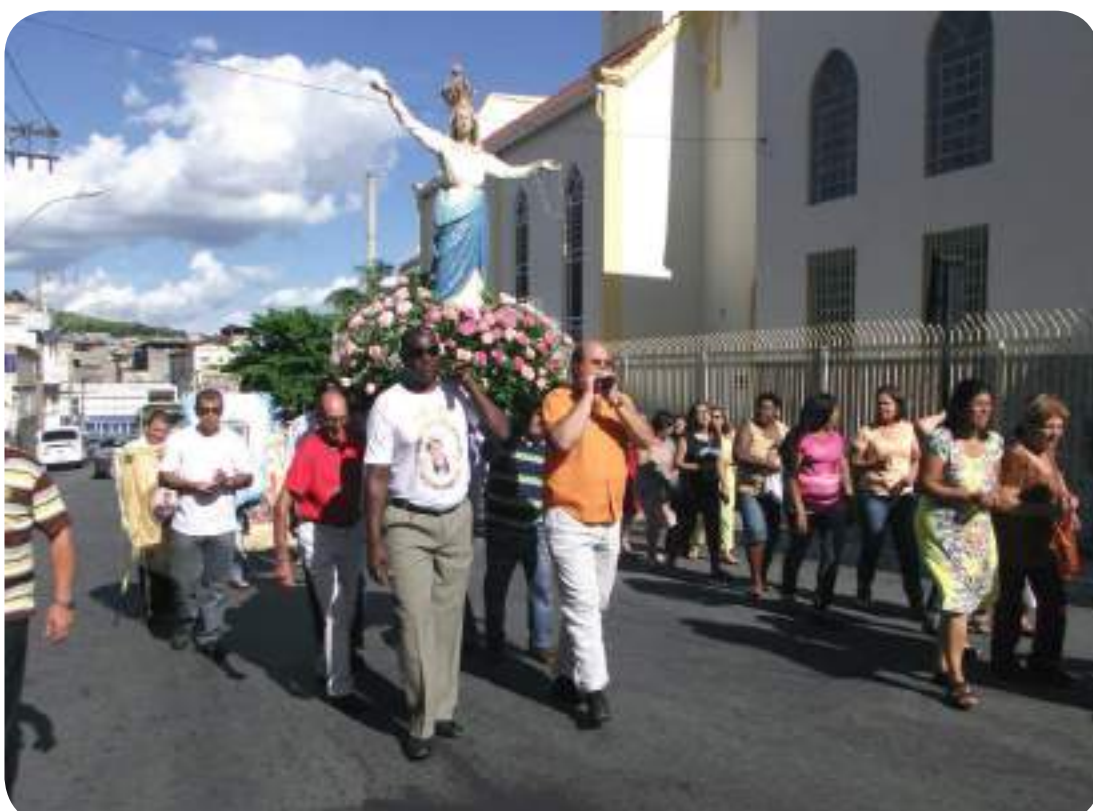
Procissão com a imagem de Nossa Senhora da Glória, em Santos Dumont

O mês de fevereiro começou festivo para a Arquidiocese de Juiz de Fora. Vários momentos importantes marcaram a comemoração pelos 90 anos de criação da Diocese. Dentre tantos atos e festividades, a criação de quatro novas Paróquias. Depois de serem anunciadas oficialmente em uma celebração na Catedral Metropolitana, agora elas começam a ser devidamente instaladas.