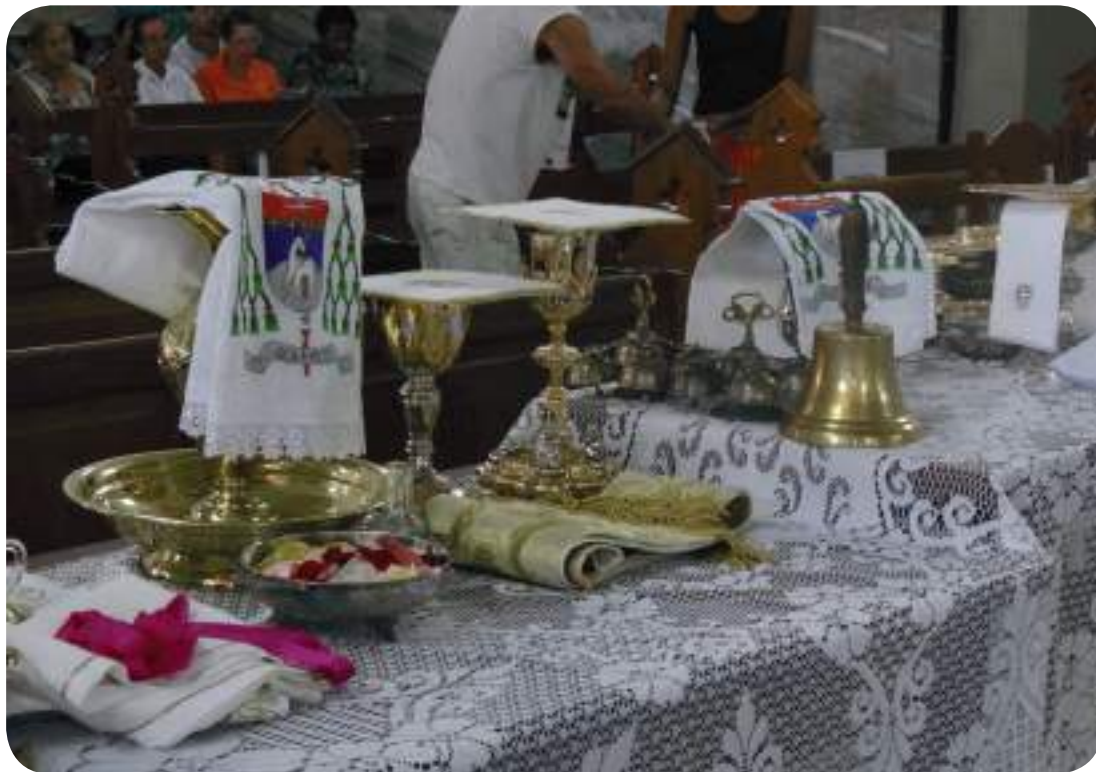
Material para o ofertório preparado para a Santa Missa