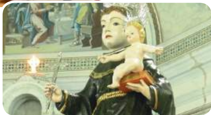
Imagem de Santo Antônio do século XVIII restaurada

Inauguração do Colégio Arautos do Evangelho