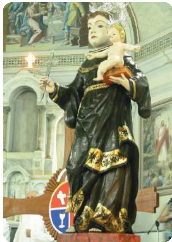
Imagem de Santo Antônio do século XVIII restaurada