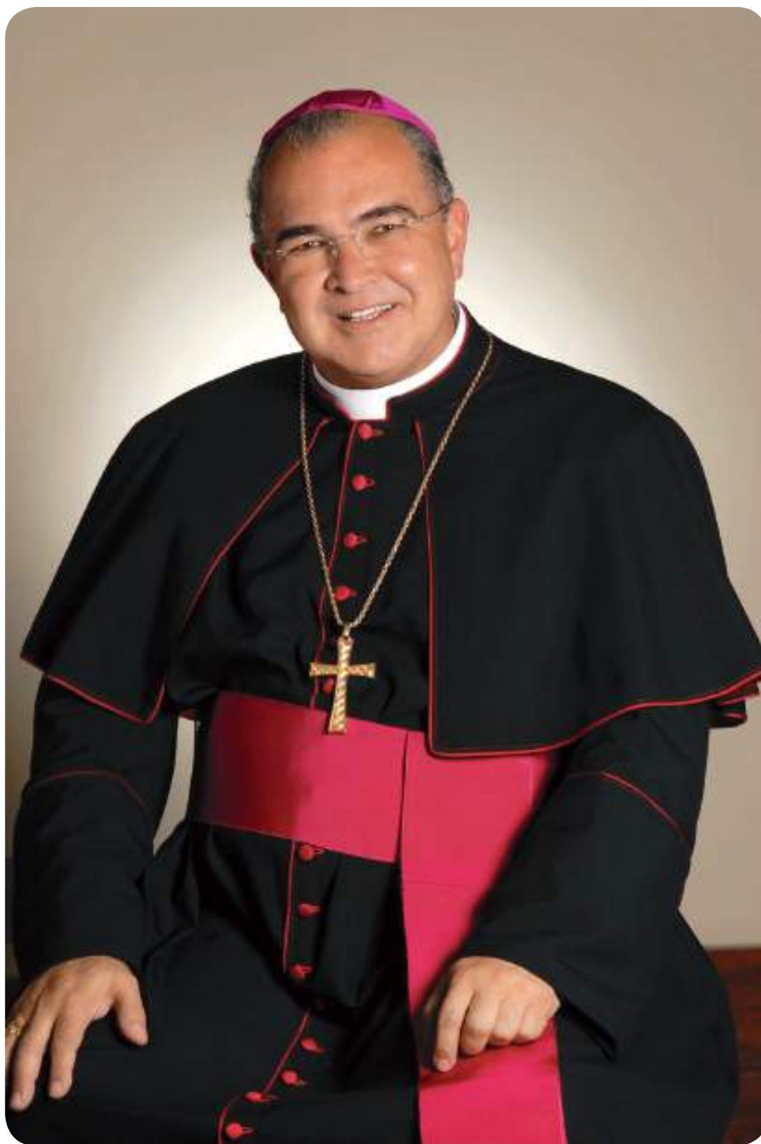
Novo Cardeal e Arcebispo do Rio de Janeiro, Dom Orani João Tempesta

foi o Bispo responsável pelo Setor de Comunicação do Regional Sul 1 da CNBB, que compreendia as Dioceses paulistas. Desde 1998, faz parte, hoje presidente, do Conselho Superior do Instituto Brasileiro de Comunicação Cristã (Inbrac), mantenedor da Rede Vida de Televisão.