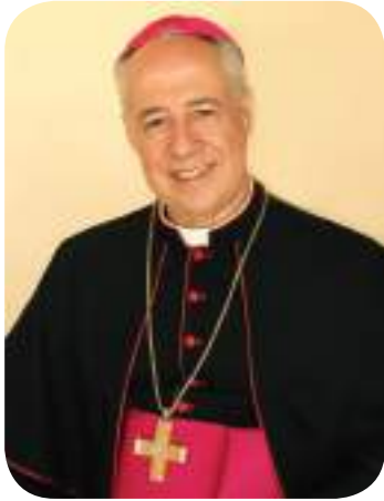
Meus caros Irmãos e Irmãs,