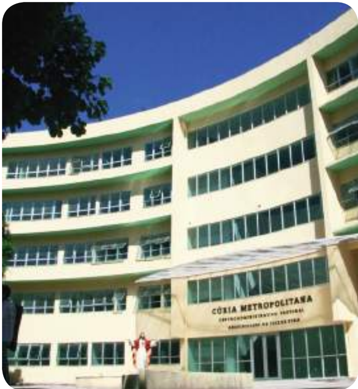
Prédio da nova Cúria.

A partir deste mês, todos os setores administrativos da Arquidiocese de Juiz de Fora terão um só endereço. Será o prédio da nova Cúria Metropolitana, que foi erguido nas dependências do Seminário Santo Antônio.