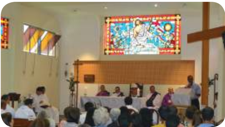
Aniversário do Seminário.

O Arcebispo Metropolitano de Juiz de Fora, Dom Gil Antônio Moreira, presidiu, no dia 1º de março, a Celebração Eucarística em Ação de Graças pelo 87º aniversário do Seminário Arquidiocesano Santo Antônio. A Missa foi celebrada na Capela do Se-