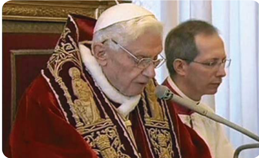
Bento XVI comunica aos Cardeais sua renúncia ao pontificado.

Convoquei-os para este consistório, não apenas para as três canonizações, mas também para comunicar a vocês uma decisão de grande importância para a vida da Igreja. Após ter repetidamente examinado minha consciência perante Deus, eu tive certeza de que minhas forças, devido à avançada idade, não são mais apropriadas para o adequado exercício do ministério de Pedro. Eu estou bem consciente de que esse ministério, devido à sua natureza essencialmente espiritual, deve ser levado não apenas com palavras e fatos, mas não menos com oração e sofrimento. Contudo, no mundo de hoje, sujeito a mudanças tão rápidas e abalado por questões de pro-