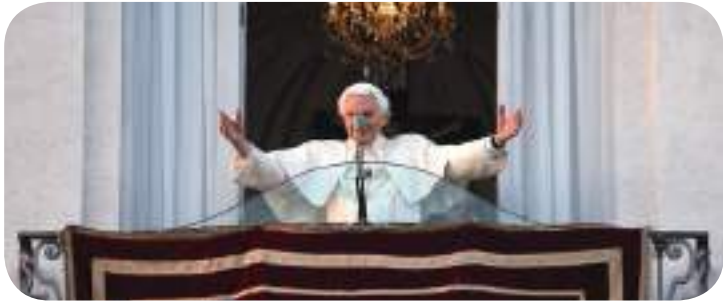
Bento XVI se despede dos fiéis.

Da varanda do Castel Gandolfo, onde ficará pelos próximos dois meses, Bento XVI disse ser "um simples peregrino". "Queridos amigos, estou feliz de estar aqui com vocês. Obrigado pela sua amizade e pelo seu carinho. Vocês sabem que esse dia é diferente dos dias que passaram, eu sou Pontífice da Igreja Católica até às 20h, após isso, não serei mais", afirmou diante de uma multidão de fiéis.