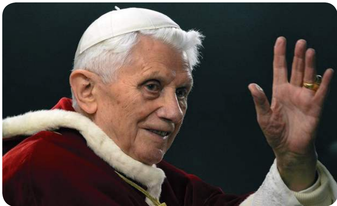
Sua Santidade o Papa Bento XVI.

Joseph Ratzinger, Papa Bento XVI, nasceu em Marktl am Inn, diocese de Passau (Alemanha), no dia 16 de abril de 1927. Seu pai, comissário da polícia, provinha de uma antiga família de agricultores da Baixa Baviera, de modestas condições econômicas, já sua mãe era filha de artesãos de Rimsting, no lago de Chiem, e antes de casar trabalhara como cozinheira em vários hotéis.