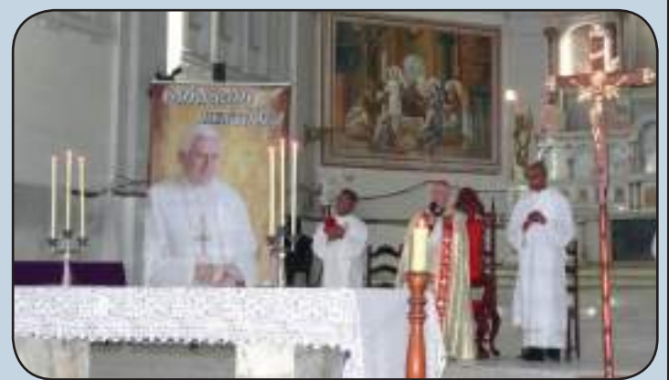
Momento da Vigília de oração por Bento XVI

A oração do Pastor foi concluída com a vibrante acla-