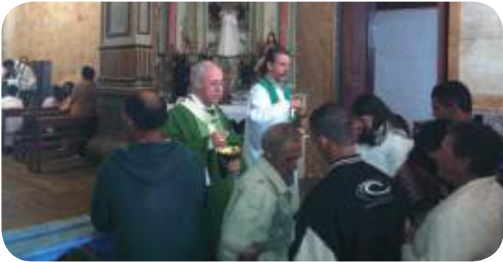
Momento da Sagrada Eucaristia