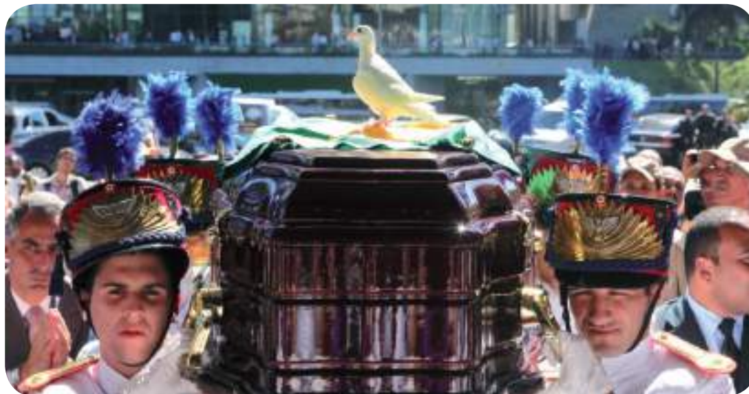
O adeus ao Cardeal brasileiro Dom Eugênio Sales, no Rio de Janeiro.