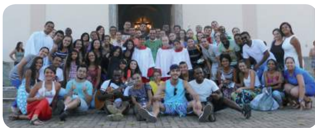
Jovens Missionários Continentais em Chiador (MG).

No sábado (17), o dia teve início com oração na igreja. O calor intenso não impediu que os jovens saíssem animados para visitar as casas das famílias nas comunidades de Penha Longa e Parada Braga. O jovem