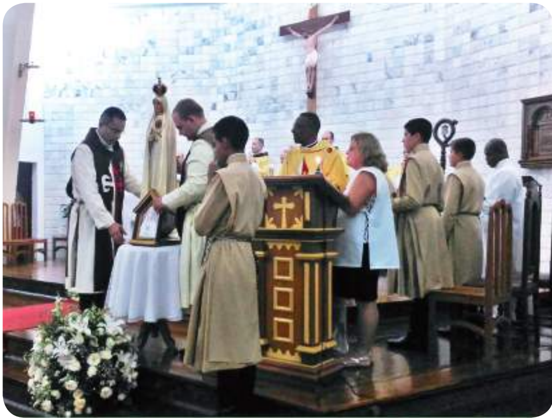
Arautos do Evangelho em missão na Paróquia Sant'Ana.

Os Arautos do Evangelho realizaram, no início deste mês, uma missão na Paróquia Sant'Ana, localizada no bairro Vila Ideal, em Juiz de Fora. Ao todo, 19 componentes do movimento participaram da atividade, entre Padres, Diáconos e Missionários. O tema da missão, realizada entre os dias 02 e 08 de fevereiro, foi "Missões para Cristo com Maria".