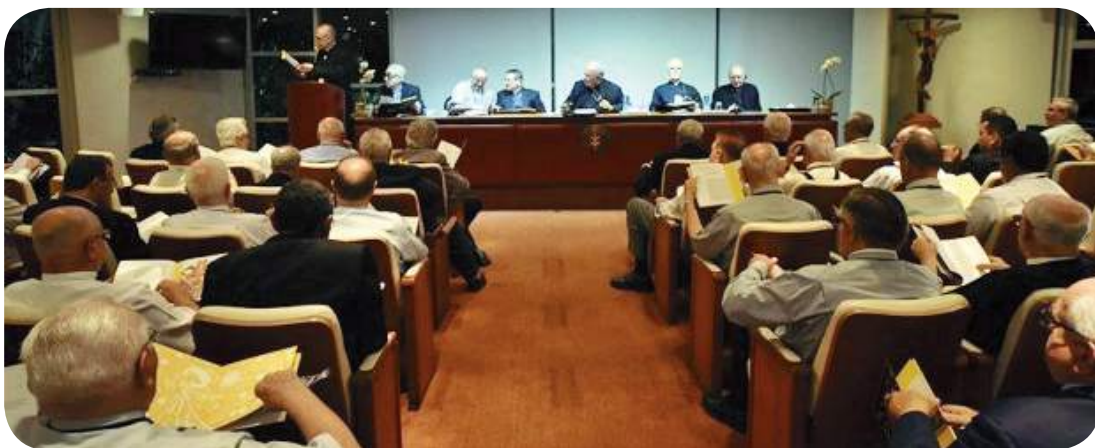
Curso para Bispos no Rio de Janeiro.

Entre os últimos dias 26 e 30 de janeiro, o Arcebispo Metropolitano de Juiz de Fora, Dom Gil Antônio Moreira, participou da 24ª edição do Curso para Bispos. O encontro é