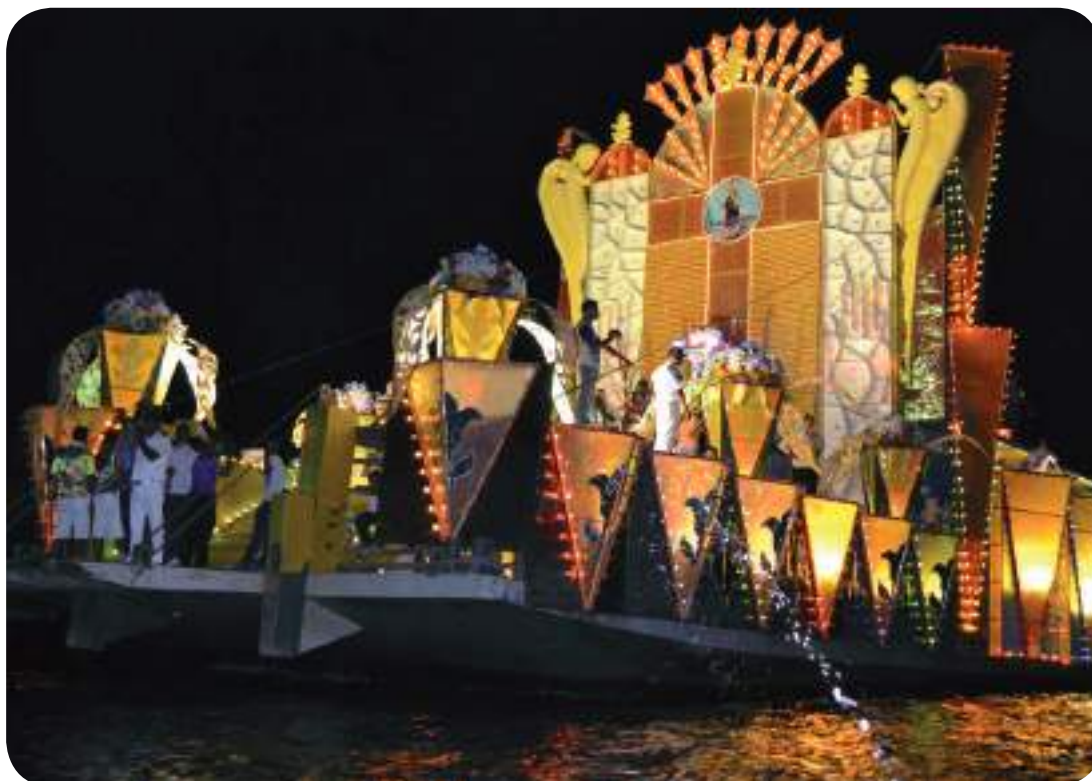
Barco ornamentado para o traslado da imagem de Santo Antônio, em Oriximiná

Colaboração: Francisco Garcia Diocese de Óbidos - Pará