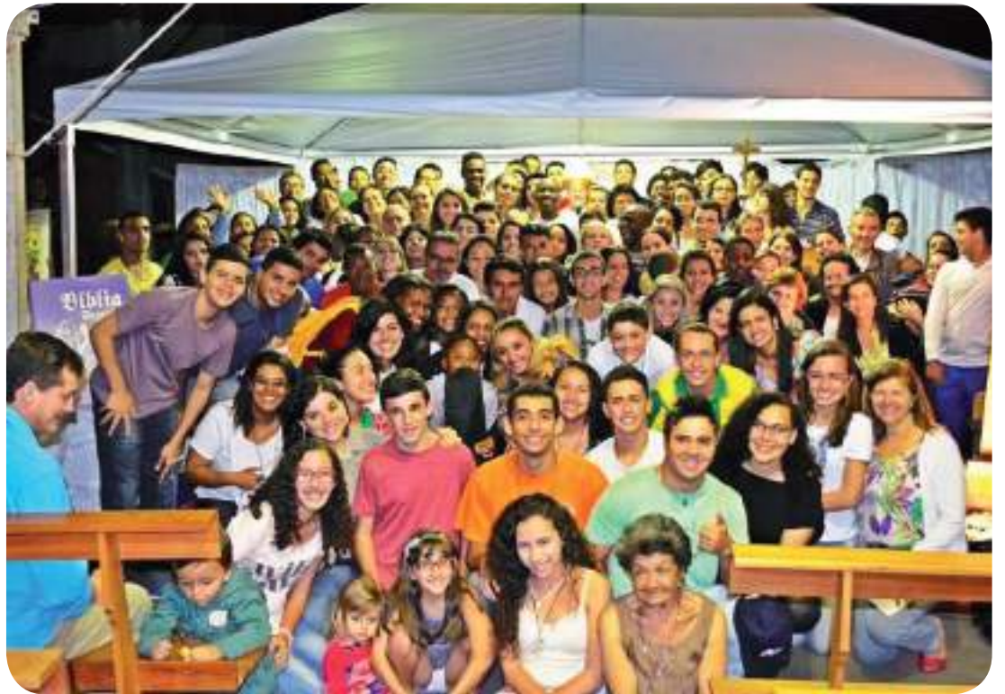
Missão na Paróquia Nossa Senhora de Lourdes, em Juiz de Fora

Colaboração: Cristiano Pires Comunidade Jovens Missionários Continentais