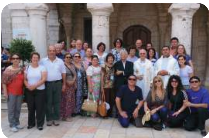
Grupo de peregrinos juizforanos em frente à Igreja de Caná da Galileia