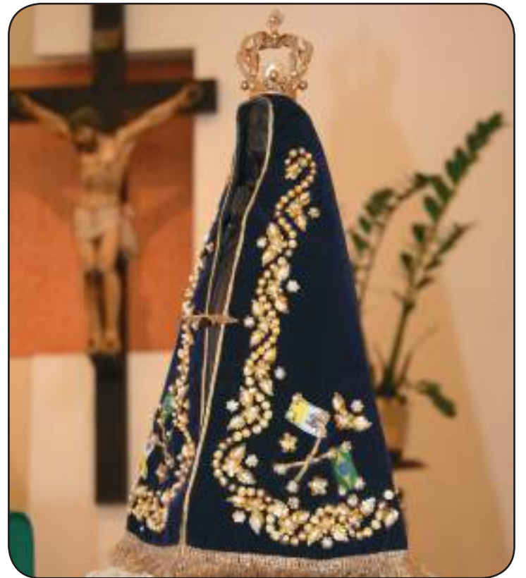
Imagem de Nossa Senhora Aparecida exposta em celebração na Capela do Seminário Santo Antônio

A partir das 9h, os motociclistas começam a se concentrar no bairro Bom Pastor para a 18ª Motociclista de N. Sra. Aparecida. De lá, conduzindo a imagem da Padroeira, eles seguem pela avenida Barão do Rio Branco, até o bairro Manoel Honório, passando pela av. Governador Valadares e pelas ruas Américo Luz e Américo Lobo, retornando para a Catedral Metropolitana. Na chegada, recebem a bênção e participam da missa das 11h30. São esperados dois mil motociclistas.