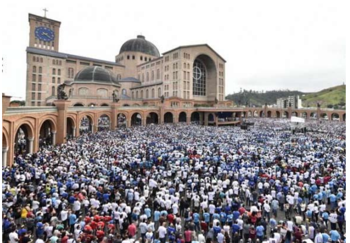
10ª Romaria do Terço dos Homens, em Aparecida.

Dom Gil presidiu a missa campal da romaria na manhã de sábado (17), na Tribuna Bento XVI. Logo depois, no altar central do Santuário, o arcebispo ministrou palestra com o tema "Terço dos Homens, em comunhão com as vocações, resgatando famílias".