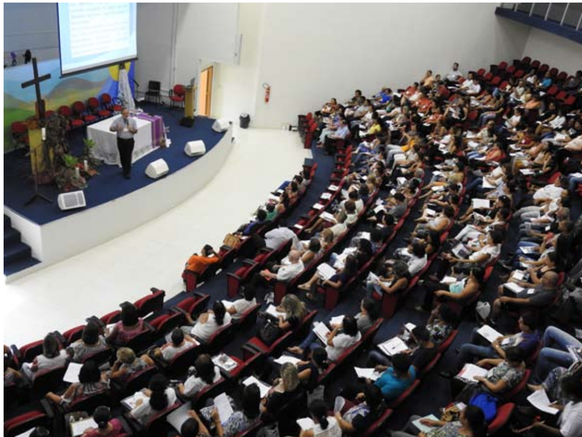
Primeiro Encontro da Escola Permanente de Formação Catequética

No decorrer dos nove meses de Escola, serão tratados três eixos de atuação principais do catequista: “o ser”, “o saber” e “o saber fazer”. Na aula inaugural, ministrada pelo Padre Nei Ângelo Furtado Moura, foi abordada a primeira parte, que