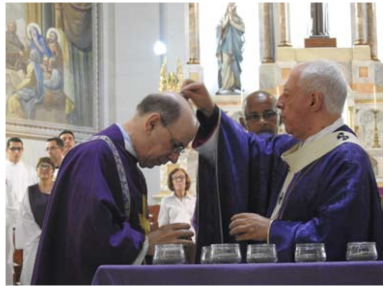
Missa das Cinzas na Catedral