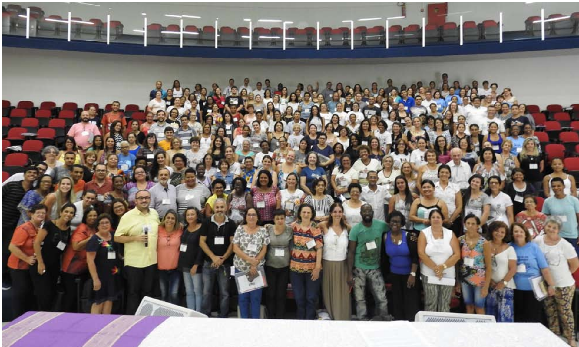
Participantes do primeiro Encontro da Escola Permanente de Formação Catequética