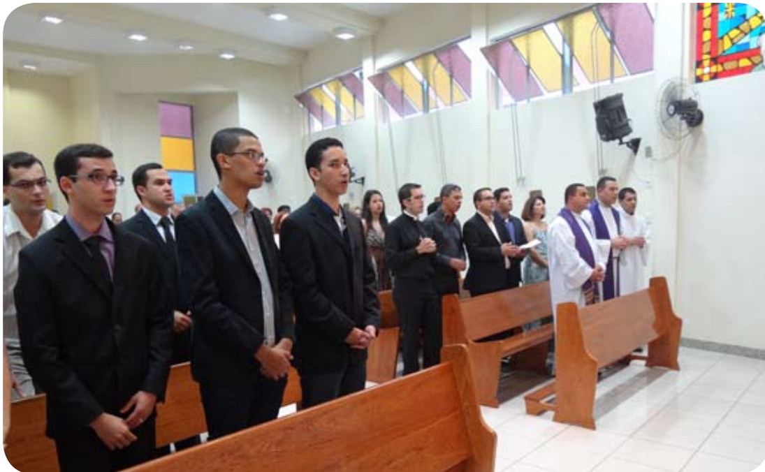
Formandos dos cursos de Filosofia e Teologia do Seminário Santo Antônio