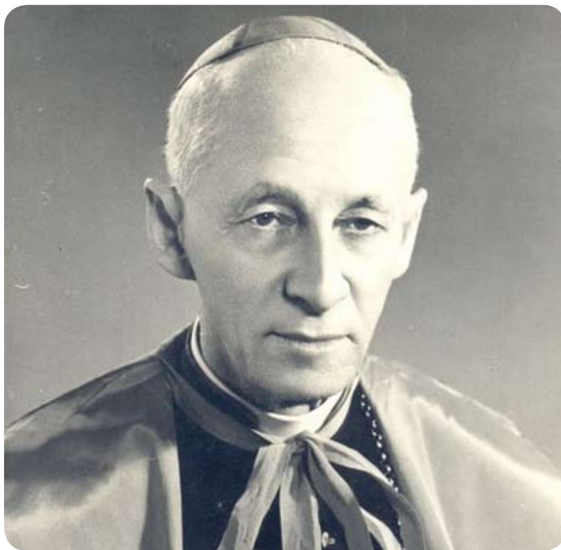
Cardeal Dom Carlos Carmelo de Vasconcelos Motta.

Em 29 de julho de 1932, foi eleito Bispo Auxiliar de Diamantina (MG). Foi sagrado Bispo em 30 de outubro de 1932, na Igreja Matriz de São José, em Belo Horizonte. Escolheu como lema de seu episcopado as palavras do Apóstolo São João: In Sinu Jesu (No Coração de Jesus), referindo-se à passagem da Última Ceia: “Um dos discípulos, ao qual Jesus amava, estava recostado no coração de Jesus” (Jó 13, 23). Foi administra-