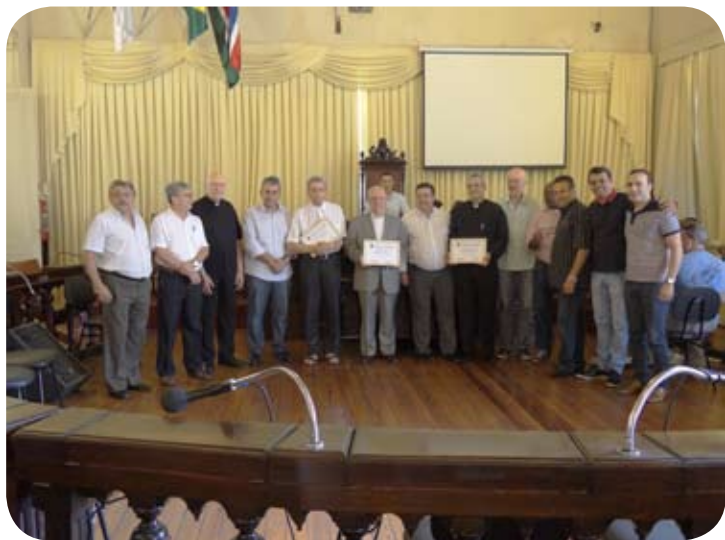
Visita à Câmara Municipal de Juiz de Fora