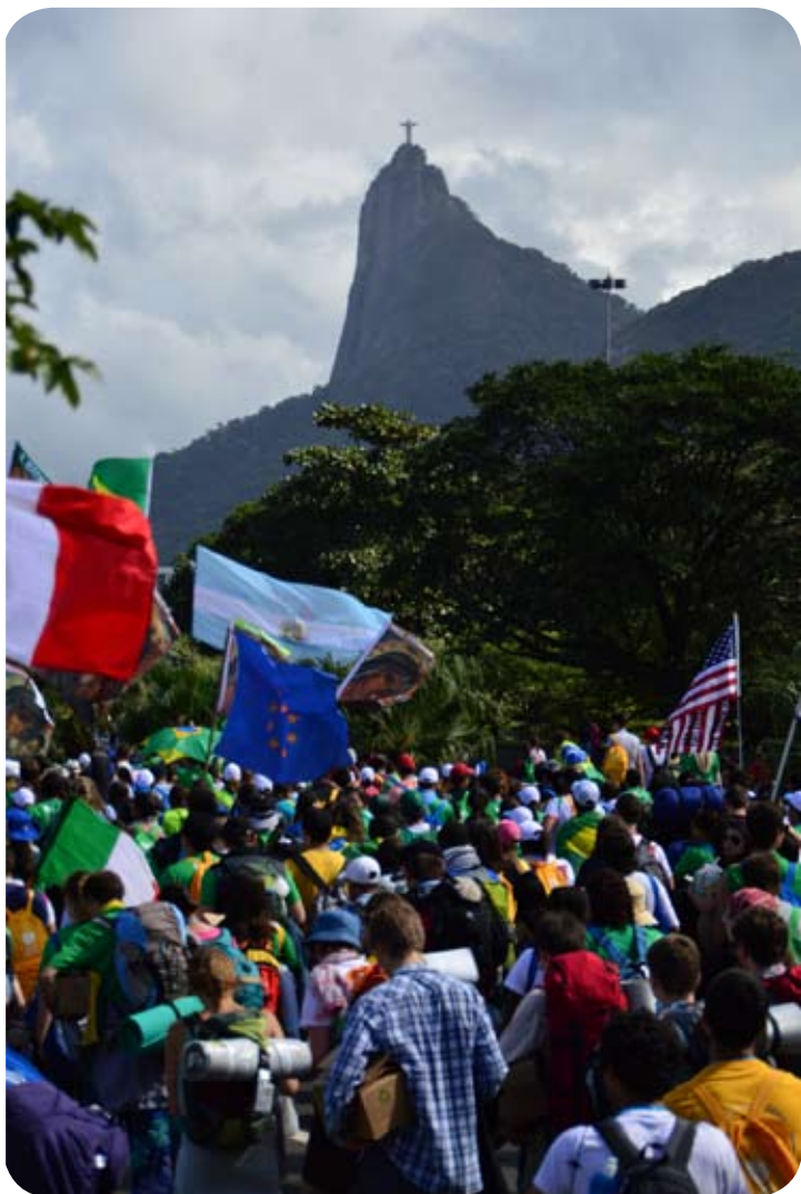
Milhares de jovens participaram da peregrinação de 9,5 km até a praia de Copacabana

Em toda a história do Brasil, nunca houve tanta gente participando de um evento em uma mesma cidade