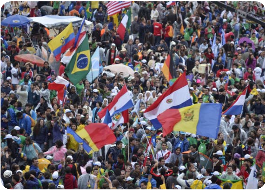
Peregrinos do mundo inteiro se reuniram em Copacabana para a JMJ Rio 2013

Nesta edição, você confere na íntegra a Homília do Santo Padre durante a Missa de envio da JMJ, que aconteceu na manhã de domingo, dia 28. Ao final da missa, o Papa anunciou que a próxima JMJ será realizada daqui a três anos, em 2016, na cidade natal de nosso estimado Beato João Paulo II, Cracóvia, na Polônia. Os peregrinos poloneses comemoraram muito nas areias de Copacabana. O Arcebispo da Cracóvia, Cardinal Dom Stanislaw Dziwisz, emitiu uma nota de agradecimento ao Santo Padre, que você também confere neste número.