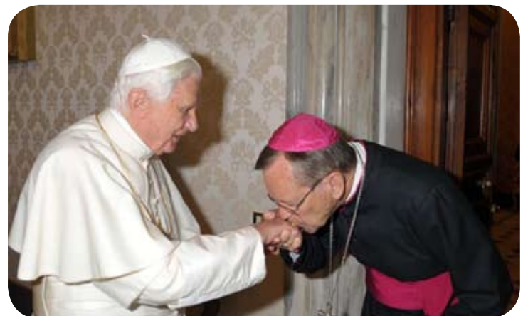
Visita Ad Limina (2010).

Dom Célio participou da última visita "Ad Limina", em Junho de 2010. Tal visita, mais exatamente "Visita ad limina apostolorum", que significa "Visita aos túmulos dos Apóstolos", é uma tradição dos Bispos Diocesanos e outros Prelados da Igreja Católica, de se encontrarem com o