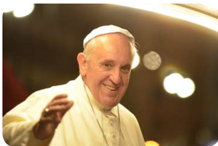
Papa Francisco na chegada para o 1º encontro oficial com os participantes da JMJ