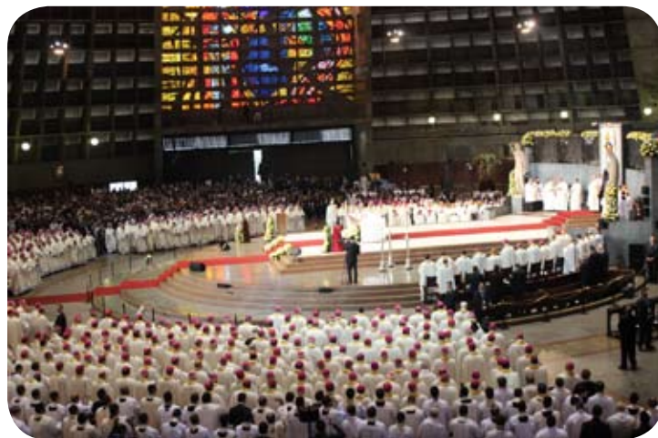
Missa celebrada na Catedral do Rio de Janeiro para Bispos, Padres, Seminaristas e Religiosos