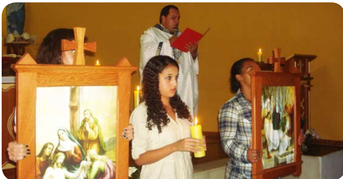
Festa de Nossa Senhora das Dores.

Após mais de 10 anos, os quadros da Via-Sacra retornaram às paredes da igreja