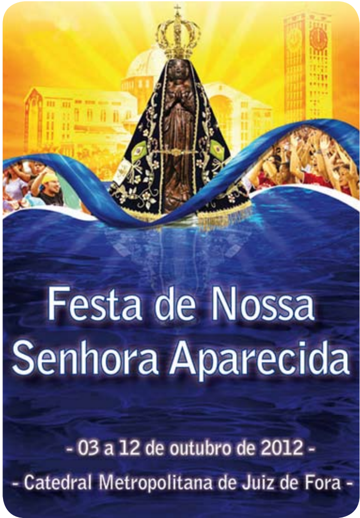
Cartaz Oficial da Festa de Nossa Senhora Aparecida

O dia 12 de outubro é mais que um feriado. Além de dedicarmos esta data às nossas queridas crianças, que são o futuro de nosso país, voltamos nossas intenções para Nossa Senhora da Conceição Aparecida, Padroeira do Brasil. A Virgem Maria é fonte de fé e devoção o ano inteiro, porém, em outubro, ganha uma atenção especial. Em Juiz de Fora acontecem várias comemorações em diversas Paróquias e comunidades, como novenas, Missas e