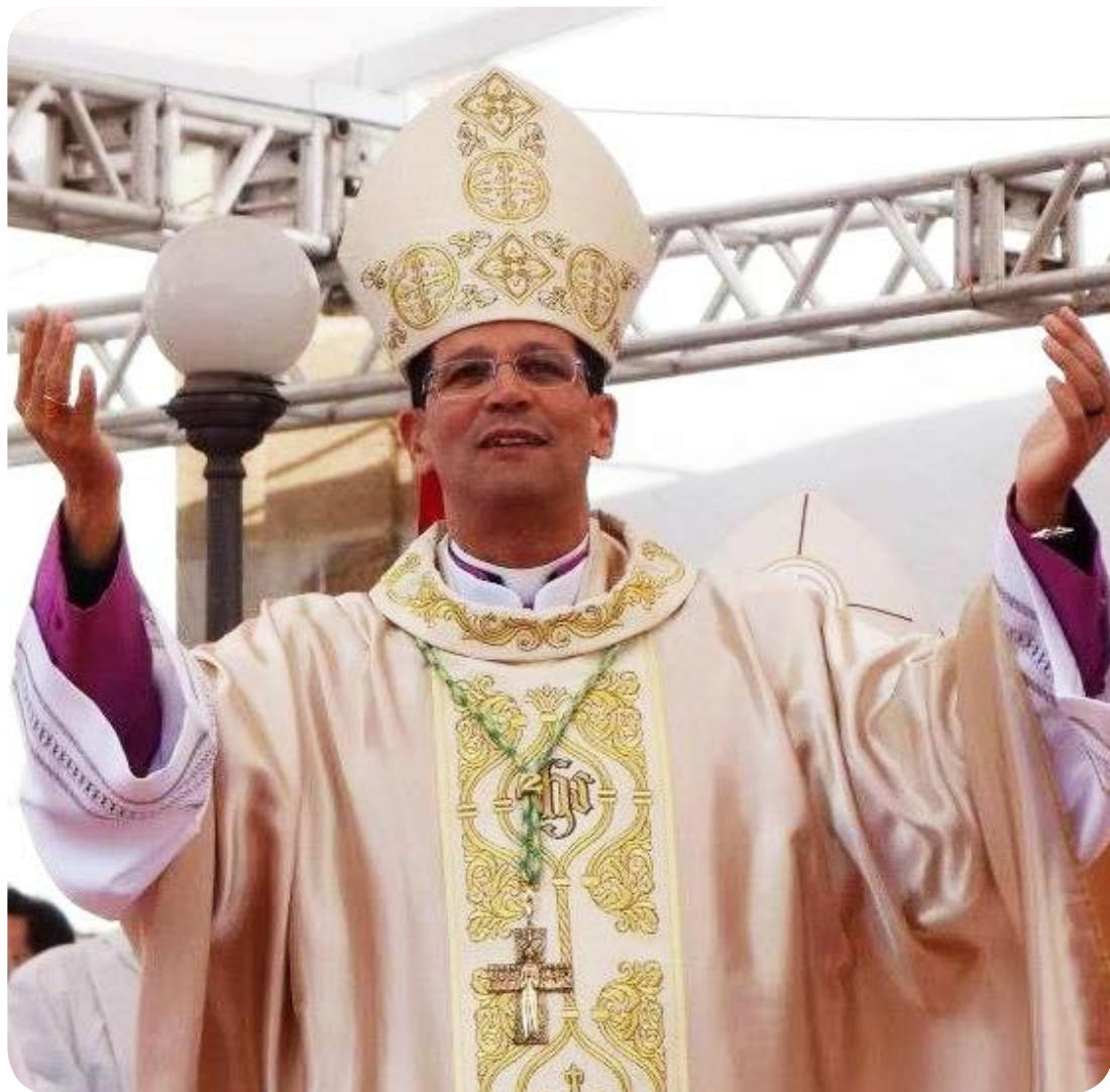
Solenidade de Ordenação Episcopal de Dom José Eudes.

Neste mês de outubro, prestamos nossa homenagem ao recém-nomeado bispo de Leopoldina, Monsenhor José Eudes Campos do Nascimento.