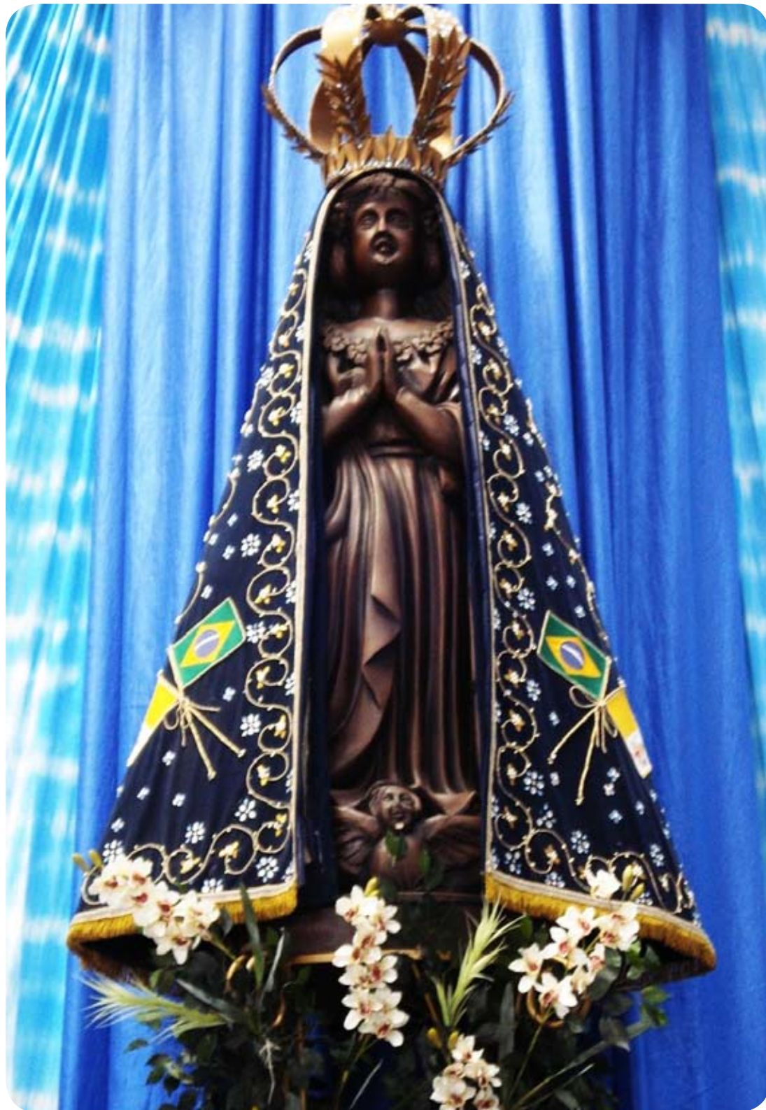
Imagem de Nossa Senhora da Conceição Aparecida, Padroeira do Brasil