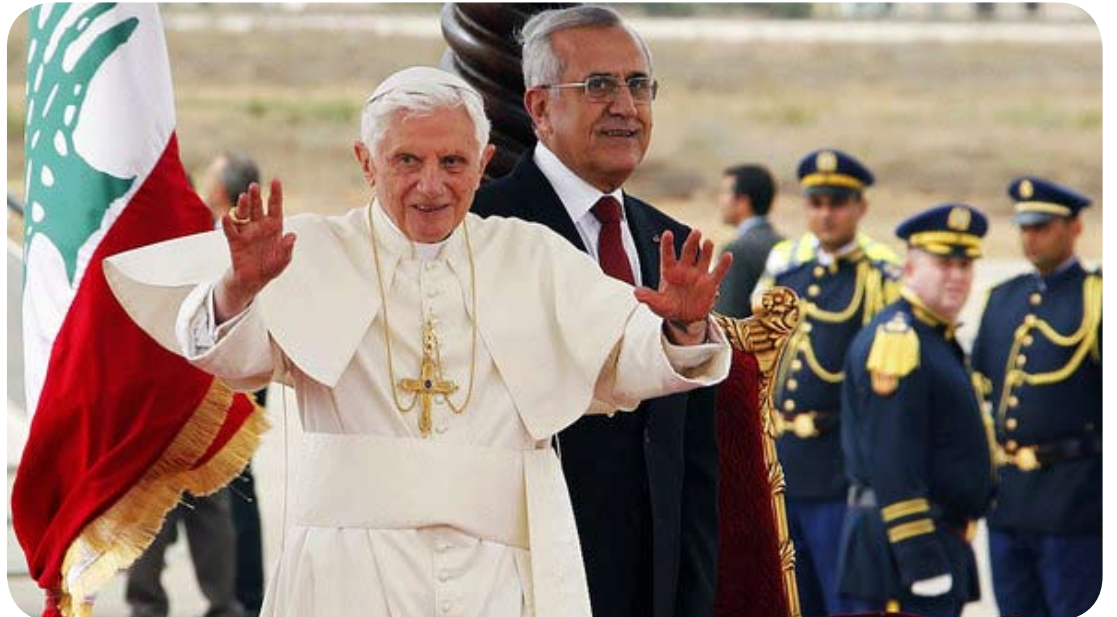
O Santo Padre desembarcou no país no dia 14 de setembro.

Entre os dias 14 e 16 de setembro, o Santo Padre Bento XVI visitou pela primeira vez o Líbano, no Oriente Médio. A visita do Pontífice foi muito importante para o país e serviu como um verdadeiro pedido de paz, tendo em vista a onda de violência e os protestos que cercam os países árabes, em decorrência da guerra civil da Síria. O Líbano não recebia a visita de um líder católico há 15 anos, desde que João Paulo II esteve no território.