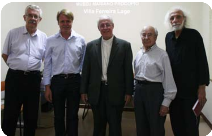
Momentos antes da reunião no MAPRO

O Arcebispo Metropolitano de Juiz de Fora tomou posse no último dia 19 de setembro, como membro do Conselho de Amigos do Museu Mariano Procópio (MAPRO). A cerimônia foi fechada, na qual participaram apenas os conselheiros do órgão.