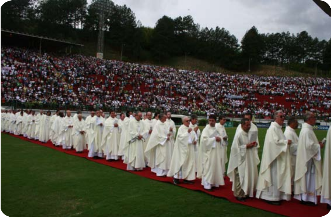
Solenidade de Corpus Christi em Juiz de Fora.

Juntos, todos comemoraram o Jubileu de Ouro da Arquidiocese de Juiz de Fora