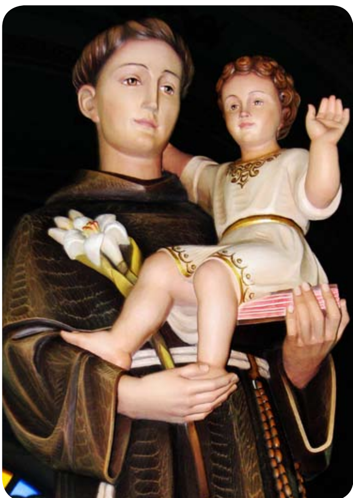
Imagem de Santo Antônio vinda da Itália