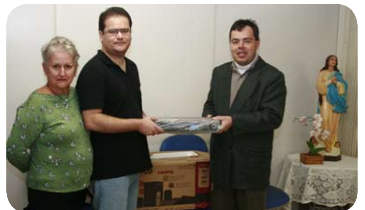
Entrega do prêmio.