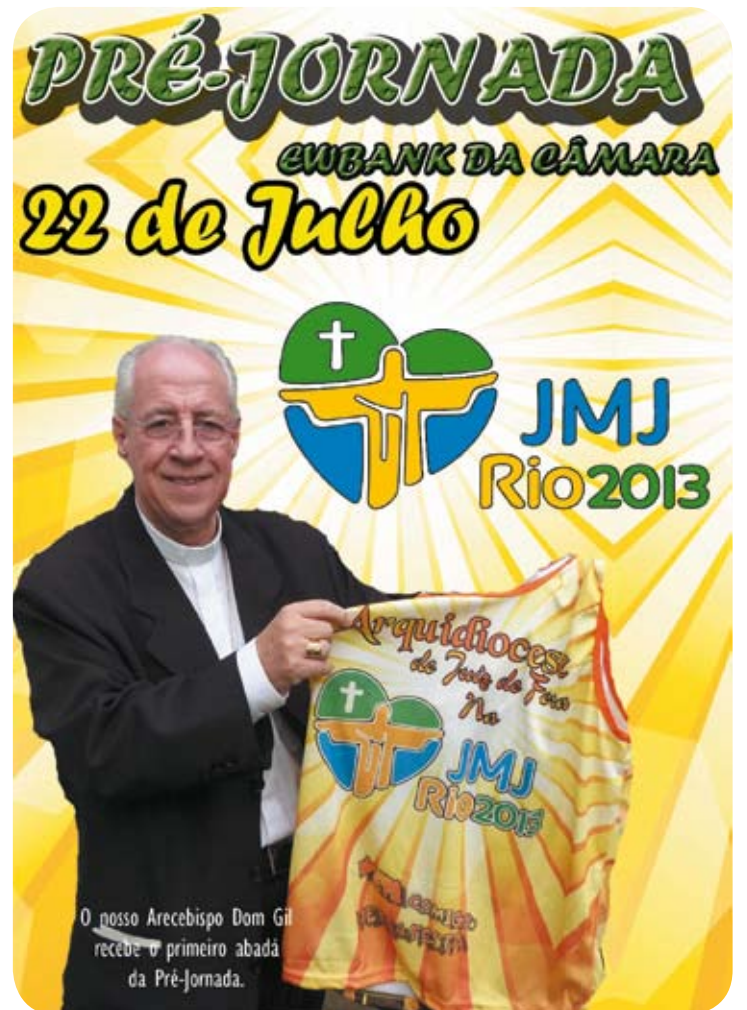
Cartaz da Pré-Jornada

O evento acontecerá no dia 22 de Julho, na Avenida Santo Antônio, na cidade de Ewbank da Câmara. A data foi escolhida por dois grandes motivos: o primeiro é porque, neste dia, a réplica da Cruz da JMJ e do ícone de Nossa Senhora estarão sendo acolhidos pela Forania Nossa Senhora da Conceição; o se-